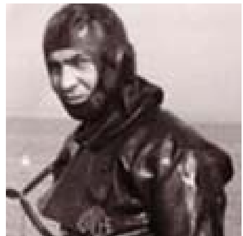
Plongeur démineur n° 237