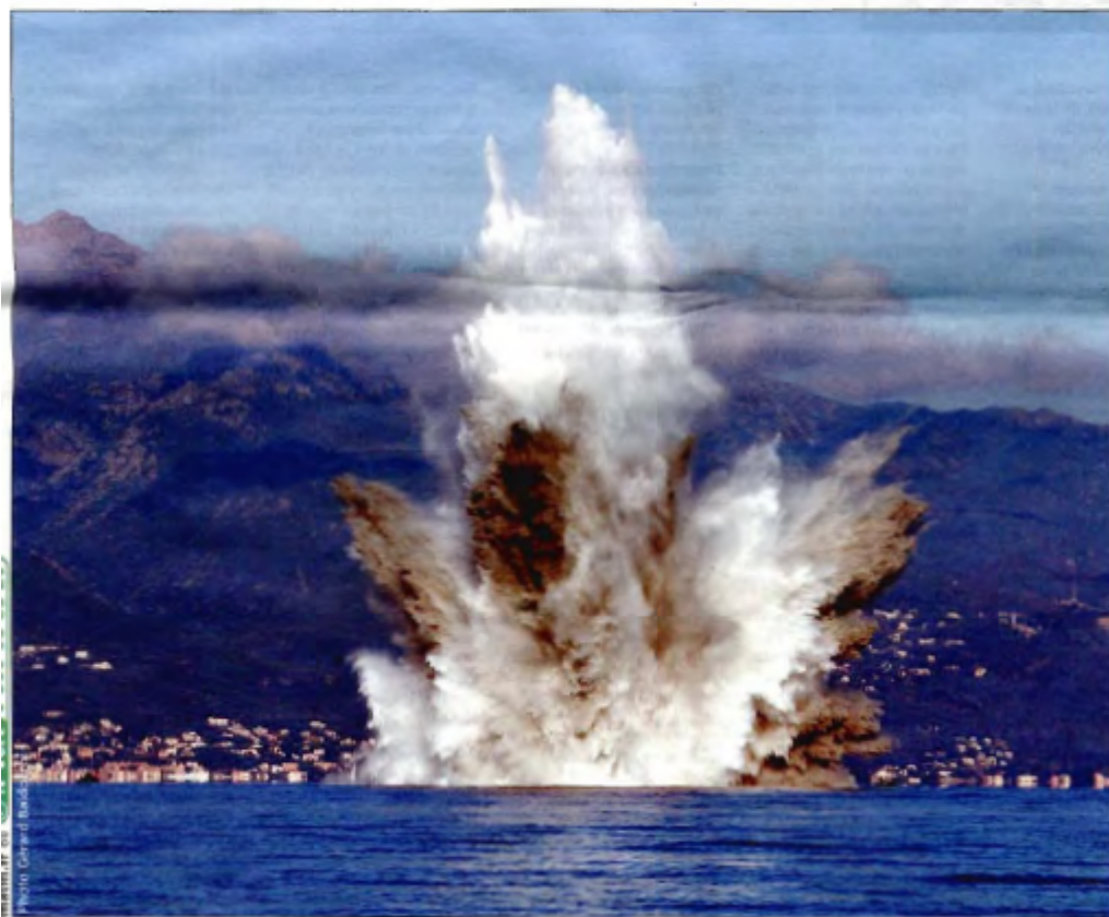
Mission spectaculaire réussie pour les démineurs de la Marine nationale LA DER

Les yeux rivés vers la mer, les Bastiais étaient en première loge, hier, pour assister à un spectacle des plus inattendus. Au large de l'anse de Ficaghjola, les démineurs de la Marine nationale ont procédé au « pétardement » de deux torpilles anglaises datant de la Seconde Guerre mondiale. Du jamais vu en Corse !