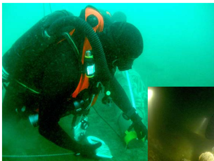
Contre-minage d'une bombe