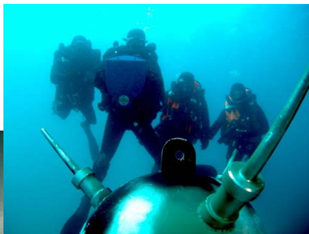
Du DC55 au Crabe