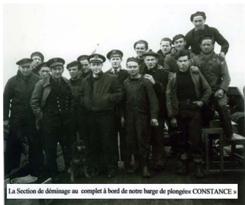
La Section de déminage au complet à bord de notre barge de plongée « CONSTANCE »

Les archives allemandes donnaient 32 champs de mines sur une distance de 55 milles contenant 2500 katymines, entre Trouville et le Crotoy.