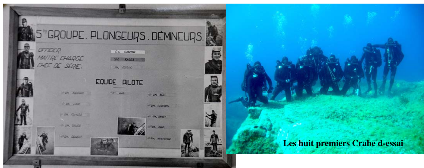
L-organigramme du 5-me GPD - Bizerte

Prix de vente grand public 60 € — prix souscription 40 €