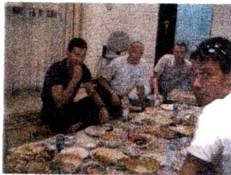
Repas chez un élève, au menu cigales de mer, taboulé et coca-cola !!!!.....

L'équipe a été bien reçue et les qataris se sont montrés très accueillant. Ils nous ont invités à partager quelques repas au sein de leur famille, et nous ont servi de guide lors des moments de détente.