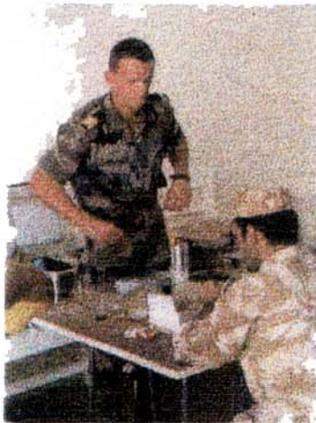
Salle de cours, confection d'un colis

La formation pratique a eu lieu dans le désert (au nord est du Qatar) où les moyens d'interventions ont pu être mis en œuvre.