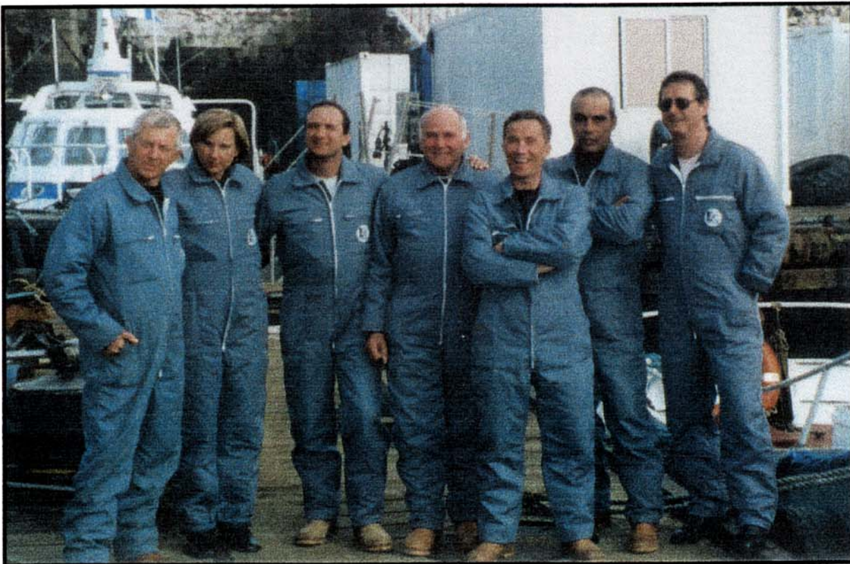
L'équipe « GEOMINE » sur le chantier du Havre OPERATION DEMINAGE DU PORT DU HAVRE

Ces cibles ont été détectées en surface et dans les couches supérieures des fonds marins par les technologies sonar à balayage latéral ( SSS ) –Sub Button Profiler ( PNG )/