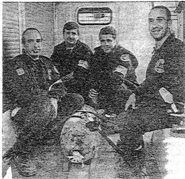
Alcibi, Faybrouette et AIF

Veillez m'excuser du court historique qui suit mais qui est néanmoins nécessaire.