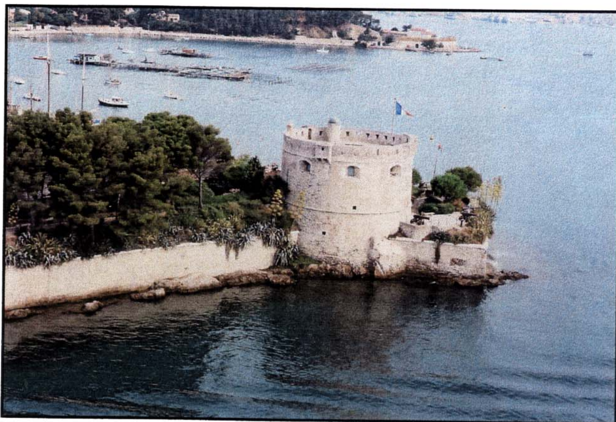
Le fort de Balaguier à la Seyne sur Mer

Le service historique de la Marine à Toulon organise sa douzième exposition, sur la défense de la rade de Toulon.