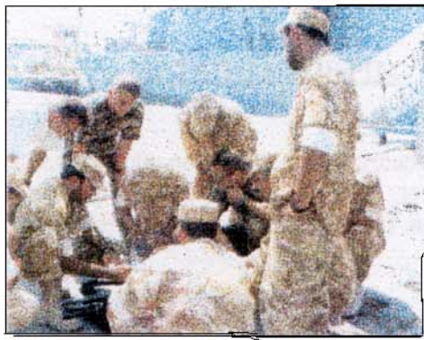
Préparation d'une reconnaissance à bord d'un bâtiment