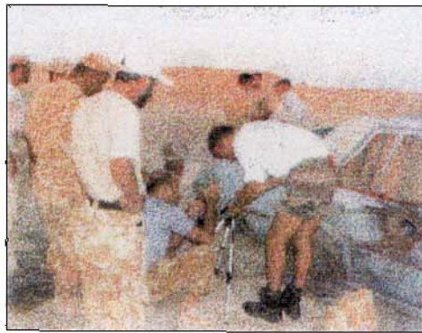
Mise en œuvre d'un moyen d'intervention sur un véhicule

La formation a été clôturée par une remise de diplômes, effectuée par le Chef d'Etat Major de la marine qatarienne.